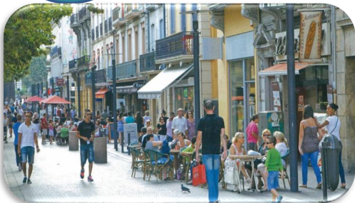
doc 1. Une rue à Perpignan.

1/ Observe cette rue et identifie quelques activités ?