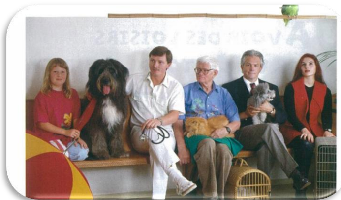
doc 2. Dans la salle d'attente d'un vétérinaire.

Dans les villes du littoral, on trouve tous les types d'activités professionnelles mais à l'approche des vacances, la majorité des secteurs, médecins, commerces, artisans et même agriculteurs ont besoin de travailleurs supplémentaires pour répondre à l'arrivée massive des touristes. C'est essentiellement les entreprises du secteur touristique comme la restauration, l'hôtellerie, les centres de loisirs, qui doivent recruter le plus de travailleurs saisonniers.