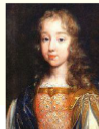
Louis XIV enfant

Relation des ambassadeurs vénitiens, Angelo Contarini et Giovanni Grimani, cité in Giovanni Comisso, Les ambassadeurs vénitiens.