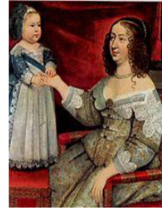
Anne d'Autriche et le futur Louis XIV

Au traditionnel titre de Dauphin de Viennois est ajouté à sa naissance celui de Premier fils de France. L'enfant est aussi prénommé Louis-Dieudonné, car, après presque vingt-trois ans de mariage sans enfant, plusieurs fausses couches de la reine et la mésentente du couple royal, la naissance inattendue de l'héritier du trône est considérée comme un don du Ciel. Certains y voient même un miracle.