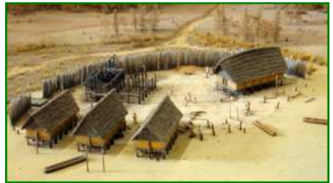
un village au néolithique

Le fait de construire des villages s'accompagne de la fabrication d' outils spécifiques pour de nouvelles activités : le tissage et la poterie naissent, qui permettent, l'un d'utiliser les fibres produites (la laine , ou le chanvre par exemple), l'autre de stocker les boissons et la nourriture.