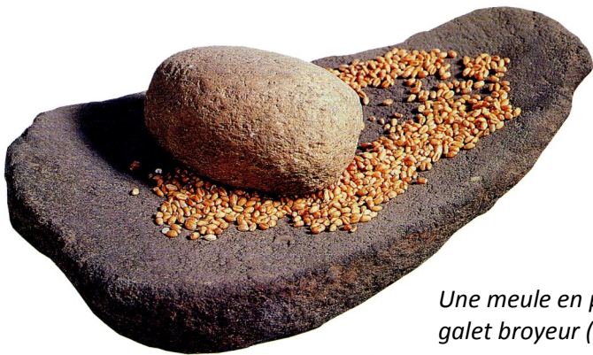
Une meule en pierre et son galet broyeur (6 000 ans)