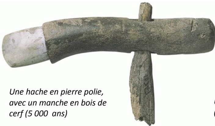
Une hache en pierre polie, avec un manche en bois de cerf (5 000 ans)