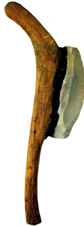
Une faucille en silex et en bois (5 000 ans)