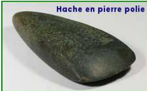
Hache en pierre polie

Suite au Paléolithique , plusieurs évolutions vont se répandre dans les populations humaines. Mais ce passage s'est produit progressivement, en fonction des conditions d'habitats des premiers hommes.