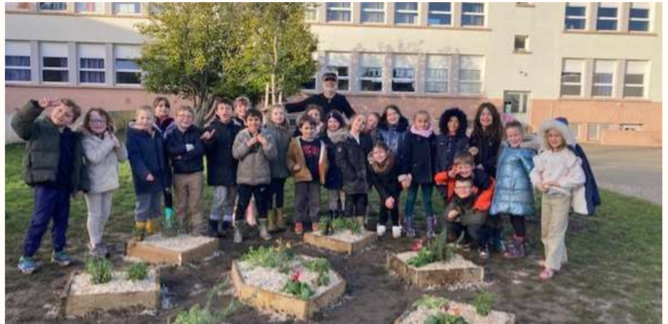
CE1 : construction d'un jardin en mandala