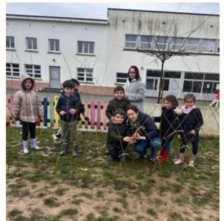
GS : construction d'un tunnel en osier