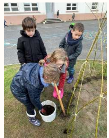
MS - GS : construction d'une cabane en osier